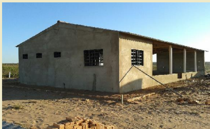
Casa de Intercâmbio Cultural da aldeia Juininha

A Casa de Intercâmbio Cultural da aldeia Juininha encontra-se em fase de acabamento e pintura, assim como a da aldeia Três Lagoas, ambas da TI Juininha . Nessas aldeias, também, foram construídas cinco (05) hati , casas tradicionais pareci.