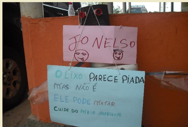
Produto do trabalho em grupo

Entre os dias 28 a 31/08, realizou-se na aldeia Três Lagoas o Curso de Educação Ambiental para os indígenas das aldeias Uirapuru, Juininha, 3 Lagoas e Sol Nascente .