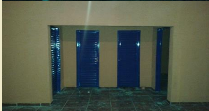
Casa de Intercâmbio Cultural da aldeia Uirapuru

No final do mês de agosto ficou pronta a primeira Casa de Intercâmbio Cultural prevista no PBAI na aldeia Uirapuru .