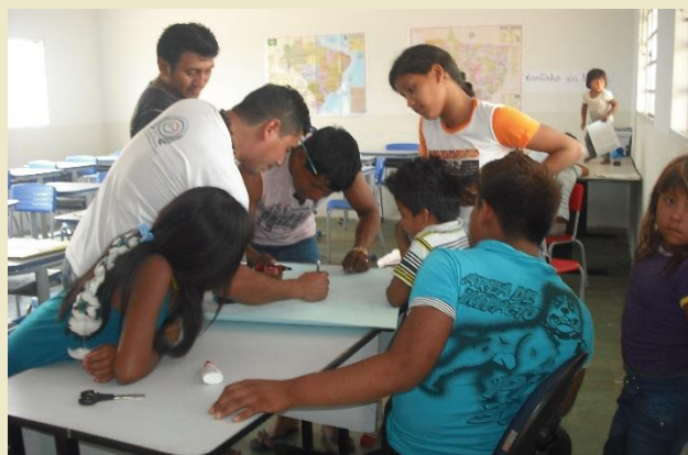
Trabalho em grupo

De acordo com o Programa de Monitoramento do Empreendimento- PMIOE, os participantes desse curso terão preferência na seleção da comissão dos indígenas que acompanharão as vistorias previstas durante do PBAI.