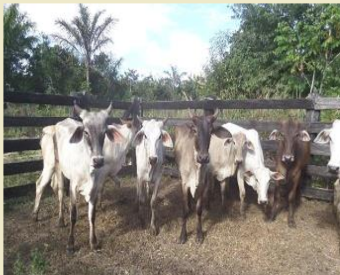
Aldeia Latundê, TI Tubarão Latundê

Na aldeia Rio do Ouro, TI Tubarão Latundê/RO , foram entregues 37 cabeças de gado, além de combustível para apoio à roça, reforma de um veículo (Toyota) e o concerto de um trator que atende, inclusive, as aldeias Gleba e Latundê, a qual recebeu, também, uma bomba d'água.