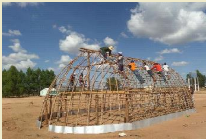
Aldeia Juininha, TI Juininha